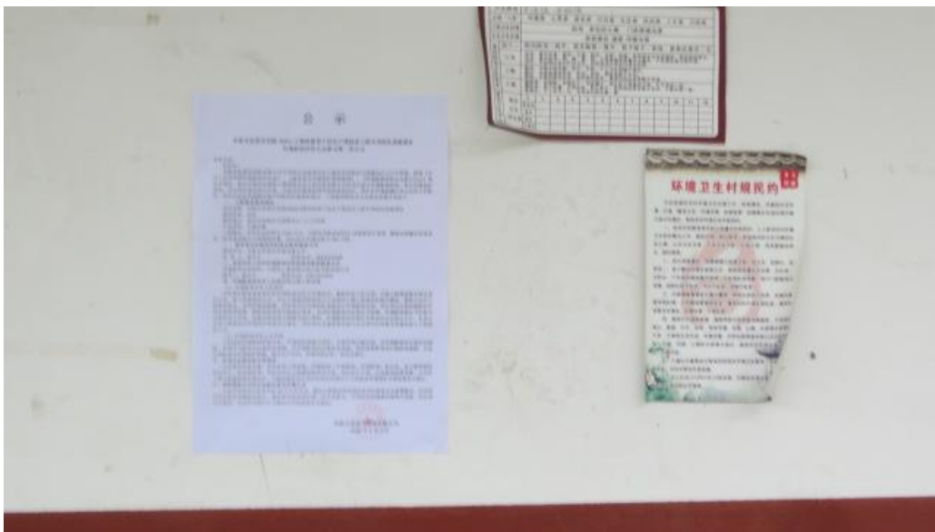
第一次现场张贴公告照片

公示时间为2018年10月15日至10月26日。公示地点为项目周边村民告知栏处。公示现场照片如下：